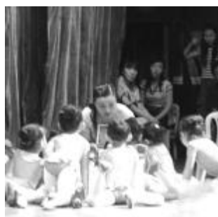
老师利用视频向孩子们授课。

据悉，为了认真贯彻《幼儿园教育纲要》，全面实施幼儿素质教育，由河南省文化厅主办、省幼儿艺术教育学会、省文化厅艺术幼儿园承办的河南省幼儿艺术教育优质课评比活动于日前在郑州举行。本届艺术节上所展示的优质课是本次评比活动中的参选课程，五节课包括了器乐、舞蹈、欣赏、美术等方面，展示了我省幼