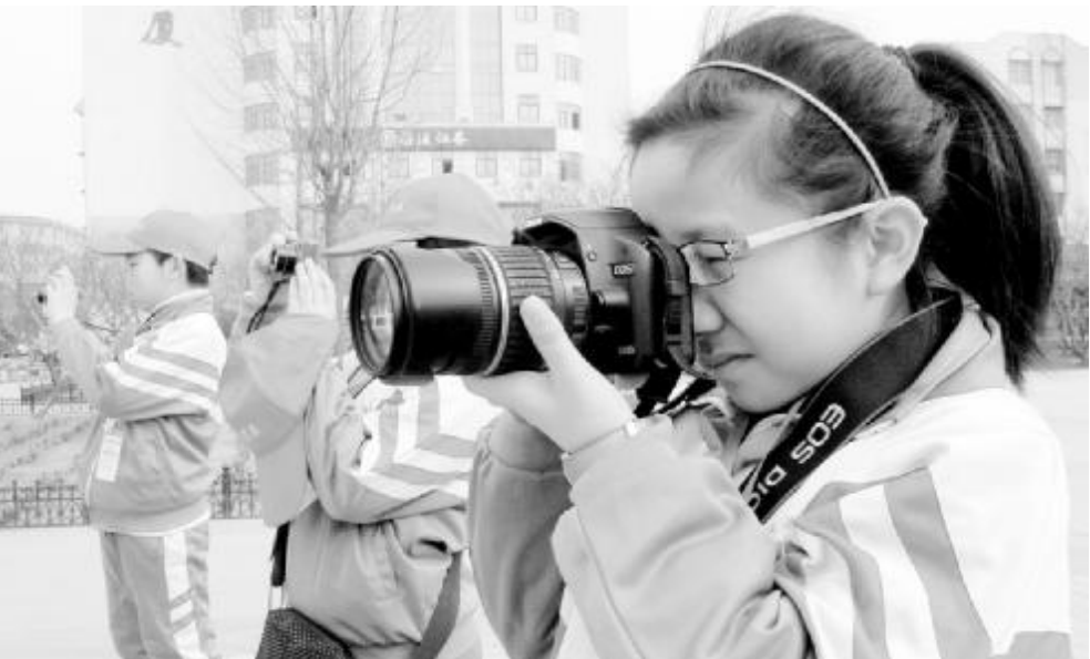
许昌市古槐街小学日前成立了“小摄影家协会”,成员都是爱好摄影的学生。他们用儿童的视角去观察和记录身边的事物,去体会瞬间艺术的美感,感受校园内外的万千世界。