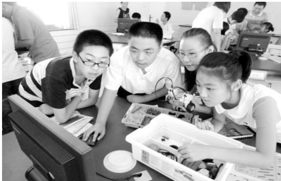
综合素质评价如何做到真实、可信、公正,是社会各界最为关注的问题

在新一轮高考改革中,普通高中生综合素质评价与减少高考统考科目、建立高中学业水平考试,组成破冰“一考定终身”和“唯分数论”的组合拳。而各方最关注的焦点,集中在综合素质评价这个软标准是否能成为真正的硬杠杠。专家指出,必须进一步加强评价的科学性、可比性,同时建立完善的公示、监督机制,使软标准做到可信、可用,进而促进高中教学和育人理念的全面改革。