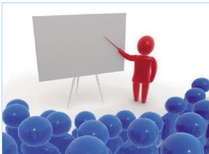
学校开创办学特色,教师修炼教学特色,让孩子享受到丰富多彩的教育

在《学校使命》一文中我明确表达了这样的观点:教育从来不求特色和品牌,只追求人的发展和人的幸福,品牌和特色在这一过程中逐渐积淀形成。为了特色而特色,