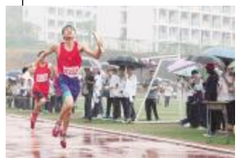
爱,应当以尊重为前提

一次活动的完美,不会让我耿耿于怀。对热烈地开场,接着又不得不草草收场,我仍坦然接受。对天气骤变,学生将校服穿得五花八门;一场急雨,学生不令而逃等等一类,我都能容忍。因此,在开幕式上做出停止演出的决定,在我是最自然不过的事。没想到学生此时的想法与我们老师的想法不一致。这使我想,我们与之间还是有距离的。虽然生活在一起,但还