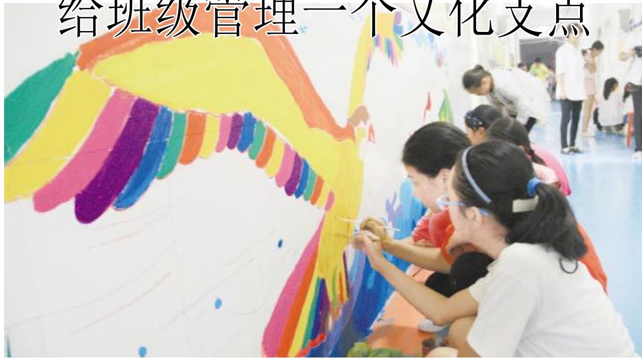
师生齐动手,扮靓班级文化墙

□ 本报记者 张利军 班级是学校最基本的管理单元,班级的管理水平直接决定着学校的管理水平。这中间,建设一支优秀的班主任队伍,便成了学校打造核心发展力的重要抓手。 然而,班主任这个“世界上最小的主任”,却并不好当。“拿钱不多管事多,管天管地还要管空气”,一些班主任的吐槽反映了我国基础教育界普遍面临的这一问题。 如何找到班级管理的抓手,让班主任工作不再无从下手、左右为难?第12届河南教育名片学校——洛阳华洋国际学校(以下简称“华洋学校”)经过近年来不断的探索和实践,做出了这样的回答——给班级管理一个文化支点,用文化支点撬动班级管理。 在第12届河南教育名片发展论坛暨“让班级文化落地生根”观摩研讨会上,记者近日走进活动承办学校华洋学校,走进特色班级,实地感受不同的文化支点带来的班级管理新气象。